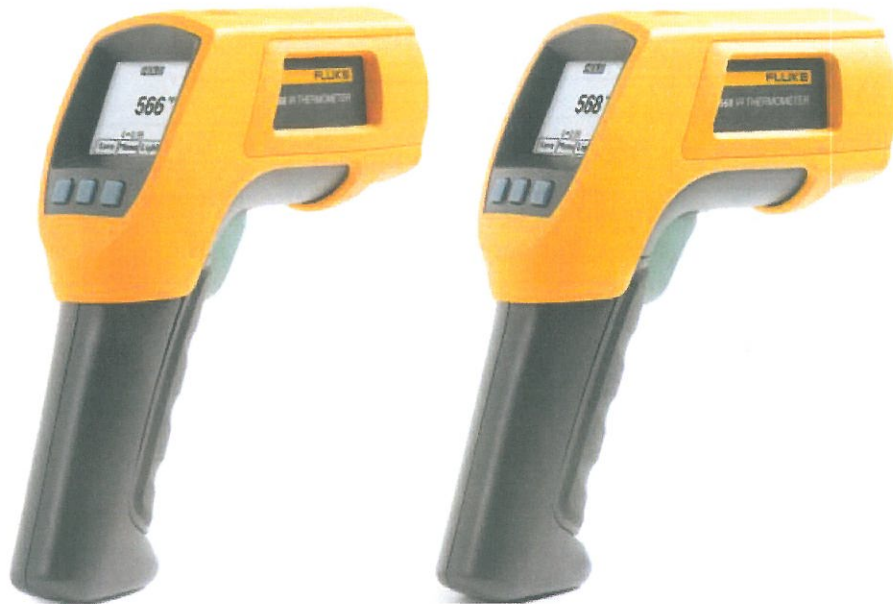
Рис.1 FLUKE моделей 566, 568.